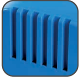
Lüftungsschlitze gemäß den Sicherheitsvorschriften